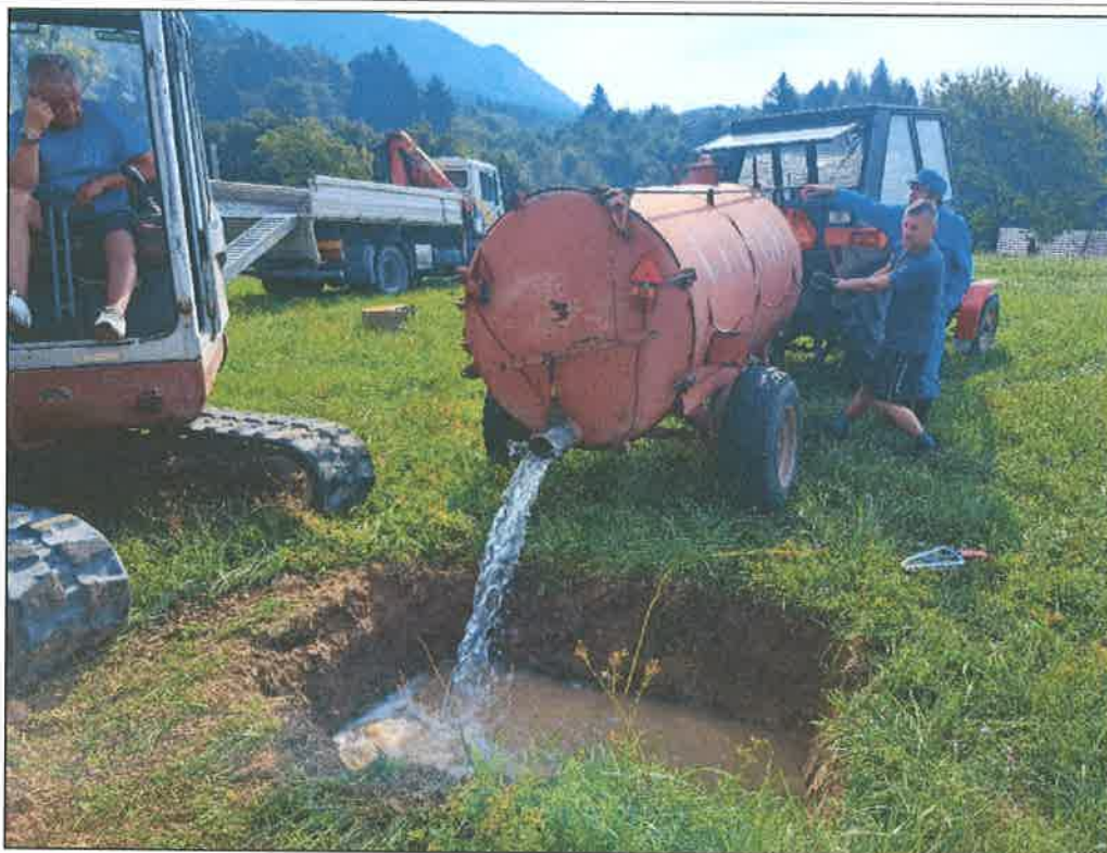
Slika 4: Izvedba nalivalnega poskusa