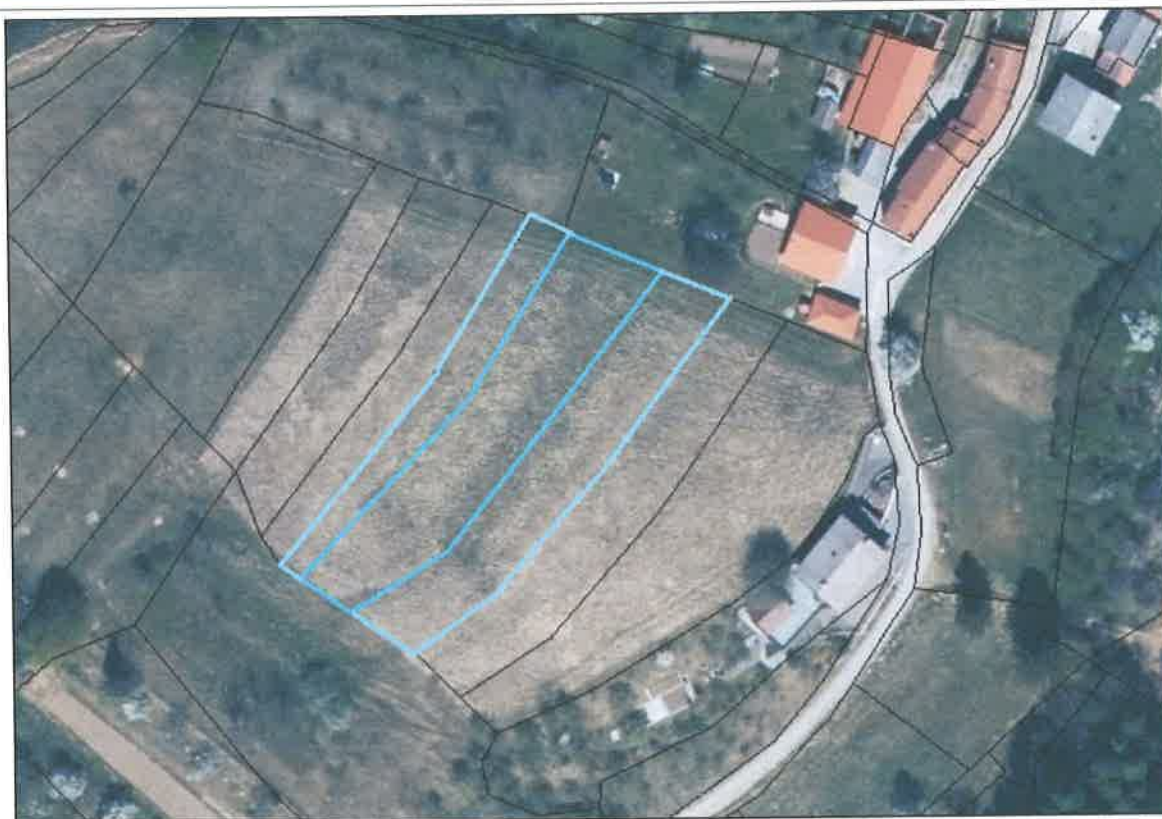
Slika 2: Ortofoto posnetek z označeno parcelo