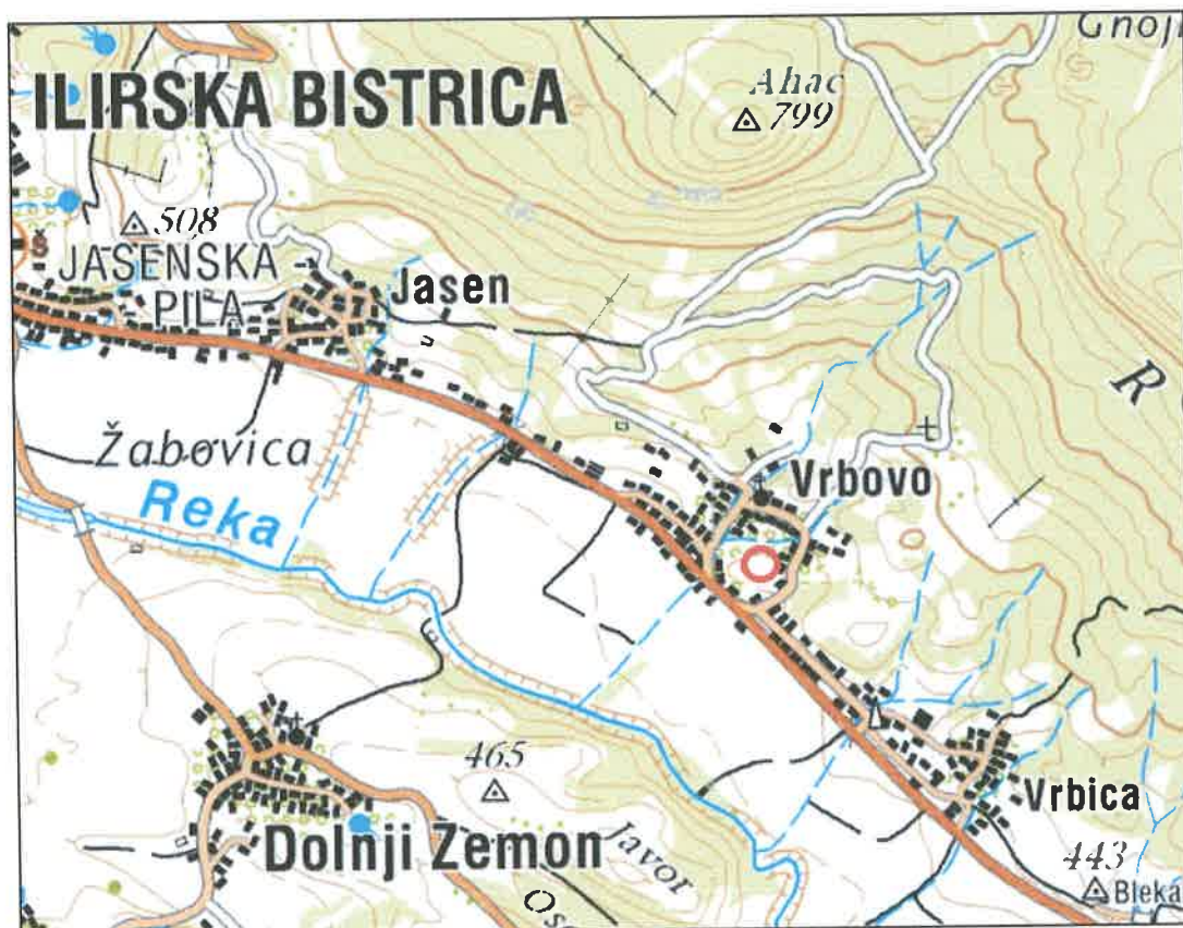
Slika 1: Geografska lokacija parcele predvidene za gradnjo

Območje predvidenega objekta leži na manjšem grebenu na nadmorski višini 440 metrov. Teren na območju gradnje je raven in delno poseljen. V okolici so travniki. Območje se ne nahaja v vodovarstvenem območju zajetij pitne vode in ni poplavno ogroženo.